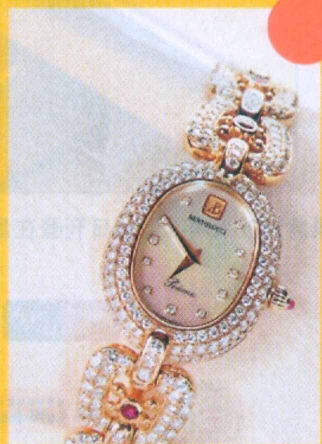
▲收藏當中，最貴是媽媽購自歐洲的Bertolucci手表，價值$450,000。